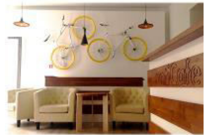
Teksta: Džingļi

3,8 miljardus gadu laikā, izmantojot ierobežotus līdzekļus, īpašā laboratorijā eksperimentāli tikuši izstrādāti 30 miljoni veiksmīgu risinājumu. Viss, kas mūsdienu zinātniekam jāspēj, ir paņemt gatavu risinājumu no šīs laboratorijas, saprast, kā tas strādā, un pielietot aktuālo problēmu atšķetināšanā. Kas ir šī laboratorija?