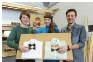
Koka tauriņi BUG