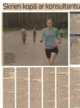
Darjas Ciganokas Skriešanas skola (darya.lv)