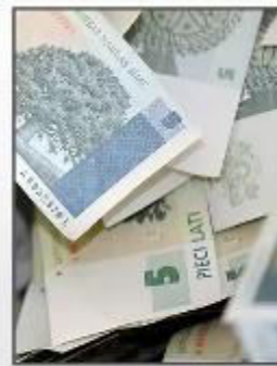
Naudas bijda bagātību nepiesaistīs, taču mūžīgu laimīgu laimību glabās gan.

No sapresētiem kafijas biežumiem izgatavotas mēbeles - www.rawstudio.co.uk . Izmantotās starpnozaru disciplīnas: pārtika + ķīmija + materiālu apstrādes tehnoloģijas.